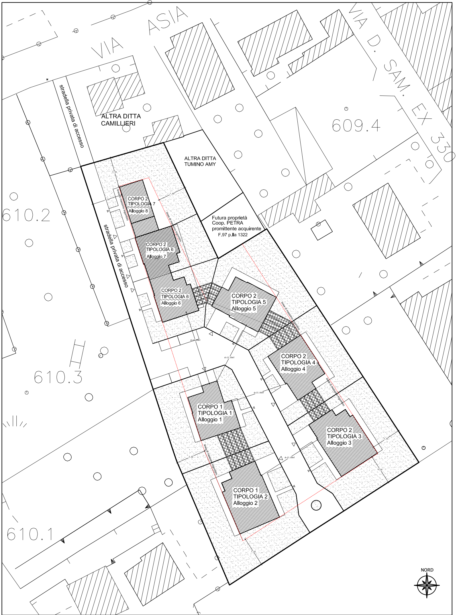
Sistemazione esterna del lotto scala 1:200