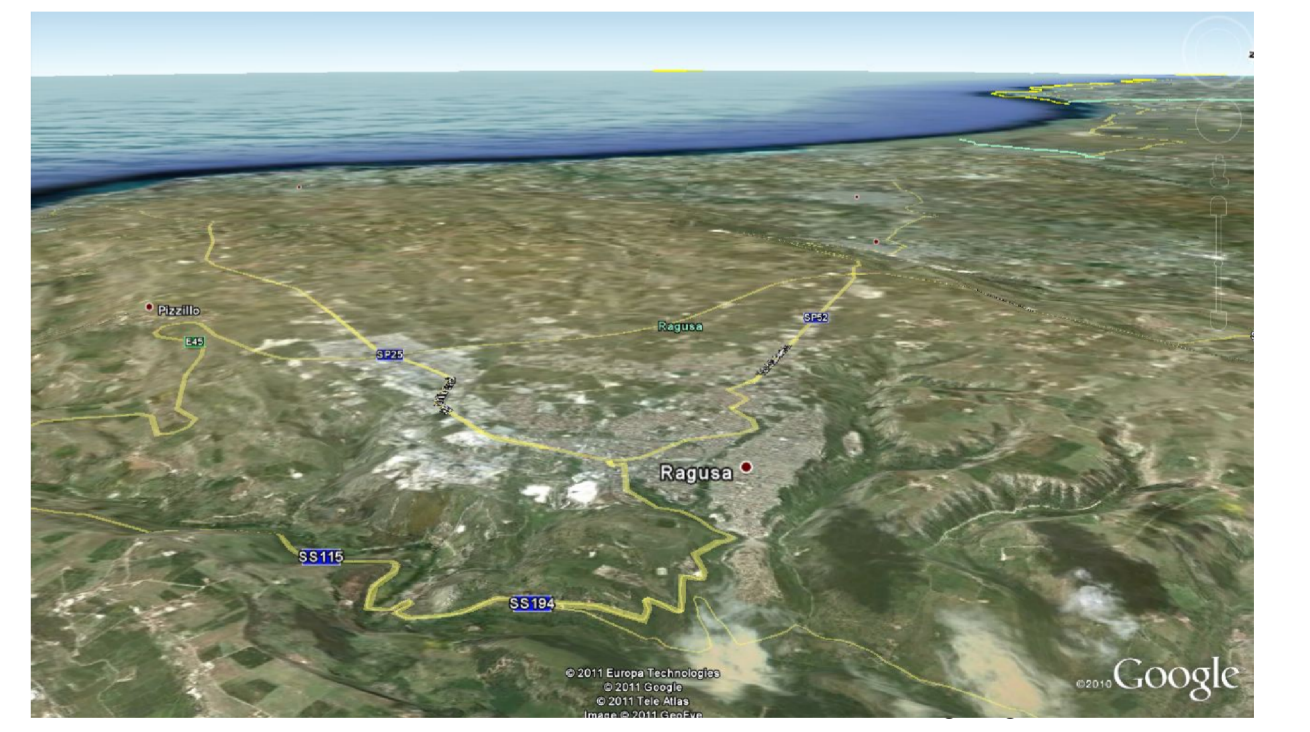
Tav 9: Carta del territorio Comunale di San Giacomo con: Viabilità - Aree per attendamenti - Ammassamenti - Attesa - Vie di esodo

Settore X - Ambiente, Energia, Protezione Civile PIANO COMUNALE DI PROTEZIONE CIVILE