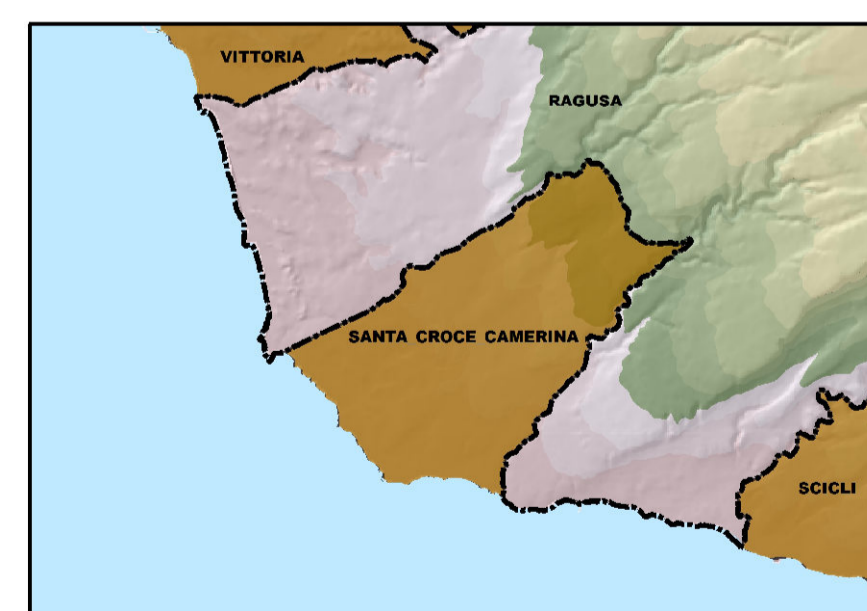
Tavola 9.6 - Alaggio natanti Punta Braccetto

Adeguamento alla L.R. n. 3 del 17/03/2016 e D.A. 319/GAB del 05/08/2016